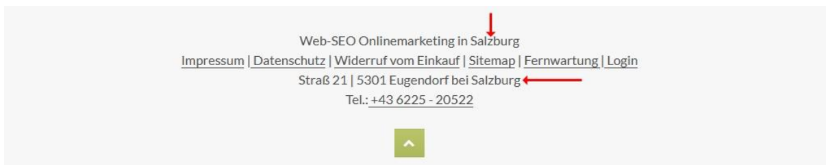
Abbildung 4: Adresse auf jeder Unterseite aufscheinen lassen

Im regionalen Bereich wichtig, die Adresse auf jeder Unterseite Deiner Webseite aufscheinen zu lassen. Mit einem CMS-System wie Joomla oder WordPress etc. sollte das keine große Herausforderung sein ( wenn doch, dann schreib mir dein Problem ), die Adresse macht sich im Footerbereich (im Bereich ganz unten) der Webseite sehr gut, wie z. B. im nachfolgenden Screenshot meiner Webseite unter https://www.web-seo.at .